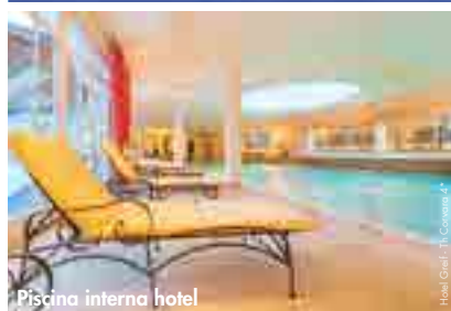
Piscina interna hotel