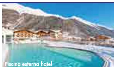
Piscina esterna hotel

SERVIZI FACOLTATIVI DA PAGARE IN LOCO: centro di bellezza, massaggi.