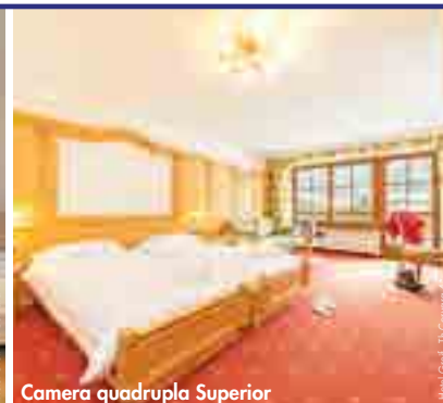
Camera quadrupla Superior