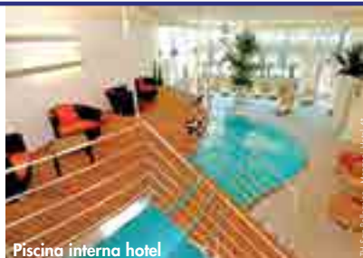
Piscina interna hotel