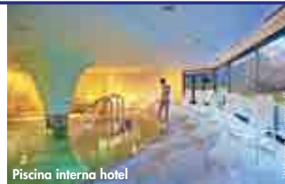
Piscina interna hotel

NOTE: inizio/fine soggiorno: libero per 1 notte, da venerdì a domenica per 2 notti, libero per 3 e 5 notti dal 24/12/19 al 08/01/20. Soggiorni di 1 o 2 o 3 o 5 notti.