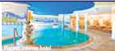
Piscina interna hotel

SERVIZI FACOLTATIVI DA PAGARE IN LOCO: garage, solarium, massaggi, culla.