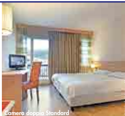
Camera doppia Standard

SERVIZI FACOLTATIVI DA PAGARE IN LOCO: massaggi.