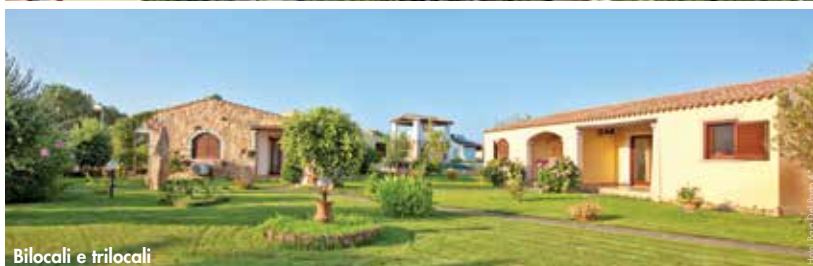
Bilocali e trilocali

PER CALCOLARE IL PREVENTIVO HOTEL + NAVE MOLTIPLICA PER DUE LE QUOTE IN TABELLA. 3°, 4° E 5° LETTO SONO SEMPRE INCLUSI NEL PREZZO.