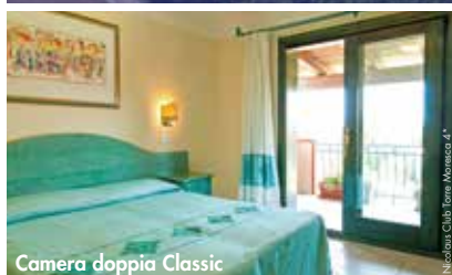
Camera doppia Classic

NICOLAUS CLUB TORRE MORESCA 4* 7 notti, All Inclusive Light, piscina e animazione incluse