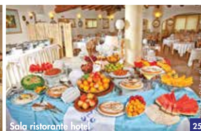
Sala ristorante hotel