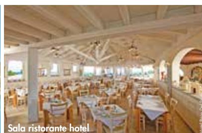
Sala ristorante hotel