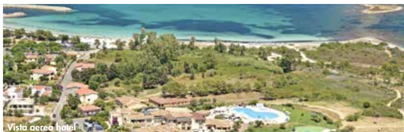
Vista aerea hotel

NOTE: inizio/fine soggiorno: da domenica a domenica. Soggiorni di 7 notti.